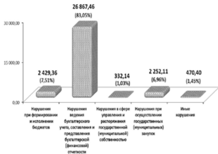
Структура выявленных нарушений в 2019 году

Наибольший объем нарушений выявлен в сферах ведения бухгалтерского учета, составления и представления бухгалтерской (финансовой) отчетности и управления и распоряжения государственной (муниципальной) собственностью.